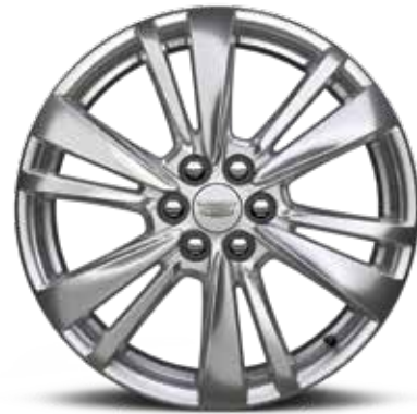
ألومنيوم قياس 20 إنش مع 6 أضلاع بلمسة مصقولة/ANDROID 1