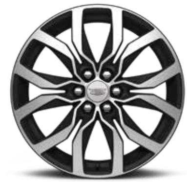
ألومنيوم DIAMOND CUT قياس 20 إنش مع 12 ضلعاً مع جيوب DARK ANDROID SATIN 1