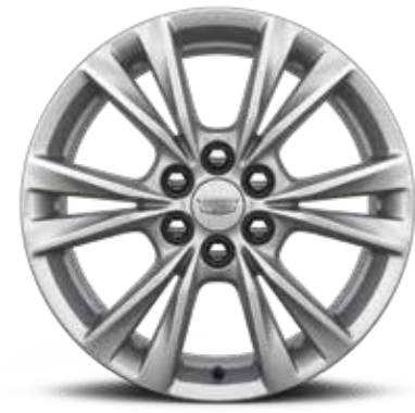
ألومنيوم بـ 6 قضبان منفصلة قياس 18 إنش مع لمسة نهائية PEARL NICKEL