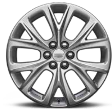
ألومنيوم بـ 12 قضيباً قياس 20 إنش مع لمسة نهائية PEARL NICKEL